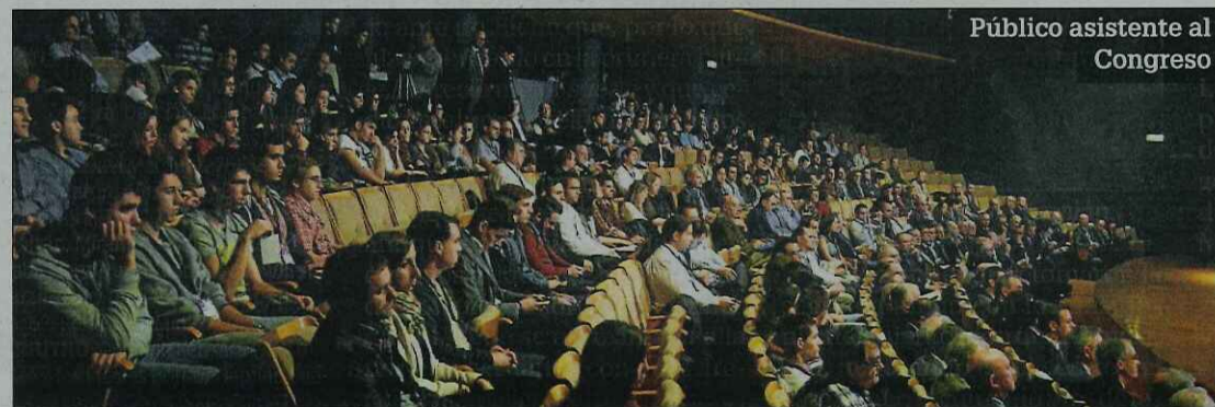
Público asistente al Congreso

El presidente del COGITI finalizó agradeciendo a todos los organismos, empresas e instituciones que han colaborado con este Congreso, e invitó a todos a conseguir el objetivo perseguido de Reindustrializar el Futuro .