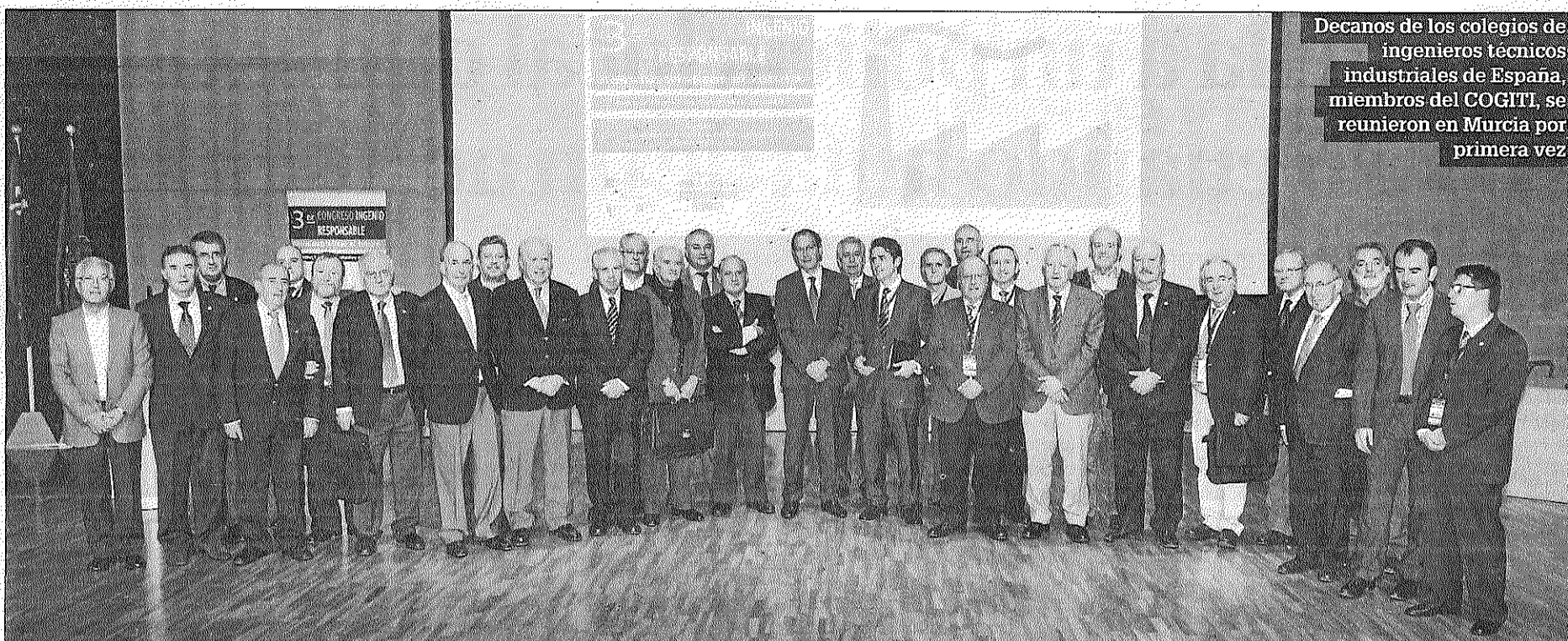
Decanos de los colegios de ingenieros técnicos industriales de España, miembros del COGITI, se reunieron en Murcia por primera vez