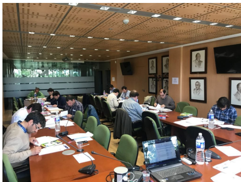
El pasado 28 de abril se celebró la última convocatoria, en la sede del COGITI.

El Consejo General de la Ingeniería Técnica Industrial de España (COGITI) ha obtenido la acreditación de ENAC (Entidad Nacional de Acreditación) como Entidad Certificadora de Personas en Líneas de Alta Tensión, cuyo objetivo final es emitir un certificado de la capacitación profesional, acorde con las normas establecidas para el desempeño de ciertas actividades. La convocatoria del pasado 28 de abril era la séptima que lleva a cabo el COGITI, y en la actualidad ya hay numerosos expertos verificadores de LAT hasta 30 kV certificados por la institución. Los candidatos deben acreditar fehacientemente experiencia suficiente en este ámbito y someterse a un examen de evaluación diseñado por expertos en la materia, que actúan con total independencia, y que garantizan, por lo tanto, la fiabilidad y transparencia del proceso de