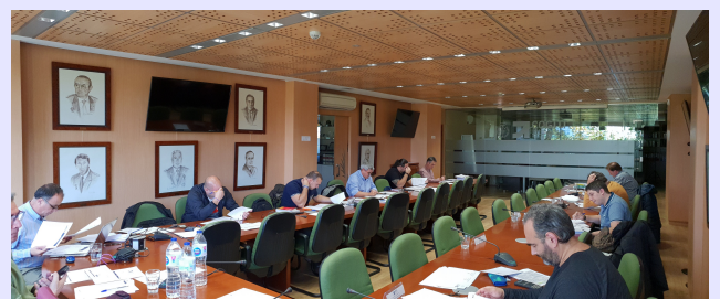
La nueva Convocatoria tuvo lugar el pasado 17 de noviembre, en la sede del COGITI.

Por otra parte, el Servicio de Certificación de Personas, en su mejora continua, y como consecuencia de las peticiones de muchos compañeros, está realizando los trámites necesarios con ENAC para ampliar la acreditación existente de Verificadores de Líneas de Alta Tensión no superior a 30kV (LAT), añadiendo la de Centros de Transformación (CCTT), todo ello acorde a la norma UNE-EN ISO IEC 17024. Esta convocatoria es exclusiva para aquellos técnicos que, disponiendo de la Certificación como Verificadores de Líneas de Alta Tensión no superior a 30kV, quieran ampliar la misma con la de Centros de Transformación. El pasado 17 de noviembre se realizó la segunda convocatoria.