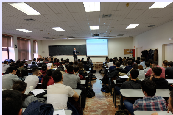
La conferencia reunió a numerosos alumnos de la Escuela Politécnica Superior de la Universidad Carlos III de Madrid.