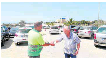
Aparcamiento de Virgen del Mar. :: CONTRAPORTADA

La inserción laboral es una de las líneas de trabajo en las que Verdiblanca pone gran parte de sus esfuerzos, como elemento indispensable y necesario para la plena integración del colectivo. Verdiblanca presta este servicio desde hace 30 años.