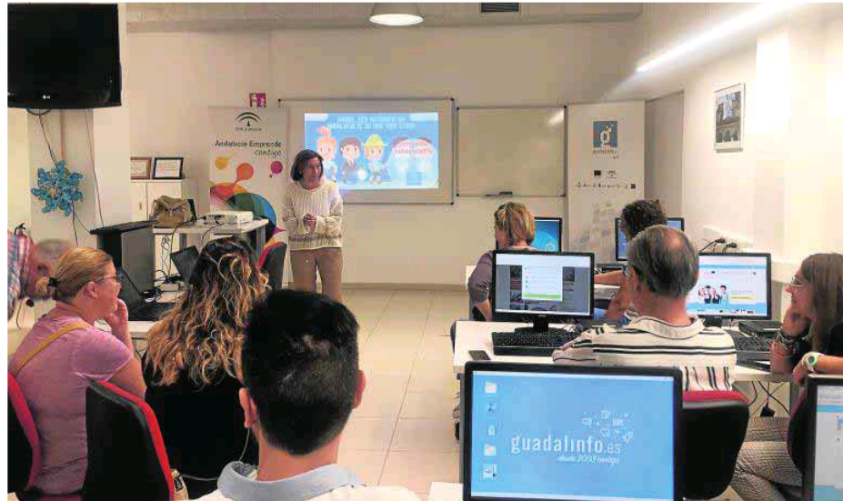
Jornada sobre autónomos celebrada en el CADE de Pechina. :: EMPLEO

de las cuotas de cotización a la Seguridad Social de los autónomos, extendiendo la tarifa plana estatal a dos años, de modo que se reduzca la carga de gastos en los estados iniciales de la actividad de estos trabajadores. Podrán solicitar estas ayudas los trabajadores autónomos o trabajadores por cuenta propia agrariados con residencia en Andalucía.