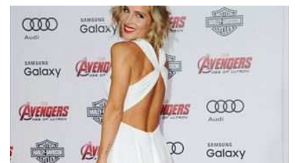
Elsa Pataky eclipsa a Scarlett Johansson en el estreno de 'Los Vengadores'