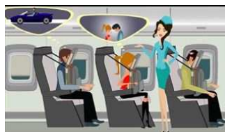
Boeing patenta un sistema para dormir hacia adelante en el avión