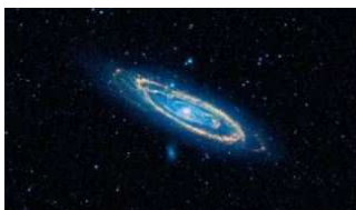
Buscan extraterrestres avanzados en 100.000 galaxias y no encuentran nada