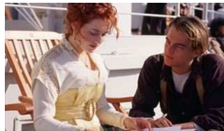
Los 15 grandes gazapos de la película Titanic