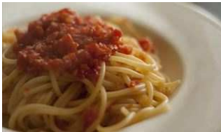
¿Cuáles son los alimentos mas consumidos por los españoles?