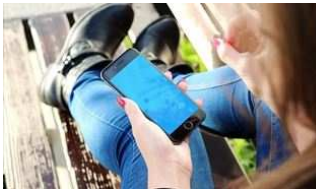
¿Sabes ya lo que es el 'phubbing'?