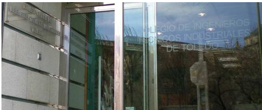
El Colegio de Ingenieros considera que son necesarias más plazas.

El Colegio Oficial de Ingenieros Técnicos Industriales de Toledo solicita a las Administraciones Públicas que éstas unan esfuerzos para que sea posible acceder a las nuevas titulaciones de Graduado en Ingeniería, ya que sólo un 5% de las personas que quieren optar al grado pueden hacerlo.