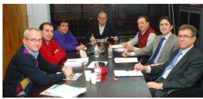
Reunión de los representantes de los colegios profesionales de ingenierías técnicas de la Región. L. O.

A. G. Los colegios profesionales de ingenierías técnicas de la Región de Murcia, que representan a 9.000 profesionales, han solicitado al Gobierno de España que redacte una real decreto en el que se establezca la homologación justa del Ingeniero Técnico actual al grado de Ingeniería, con el único requisito de demostrar una experiencia profesional de 3 años en el ejercicio de la correspondiente profesión.