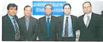
Los decanos de los ingenieros técnicos se reunieron para hacer un frente común.

Ingenieros técnicos industriales, forestales agrícolas, de obras públicas, de minas y de telecomunicaciones han denunciado que no pueden homologar sus estudios ni su experiencia y reclaman, entre otras cuestiones que se pongan en marcha pasarelas dignas para obtener el título de grado, como ocurre en Europa y en otras comunidades autónomas españolas.