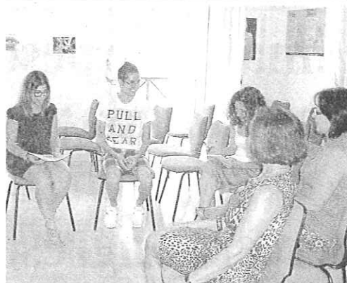
DIARIO DE ALMERÍA