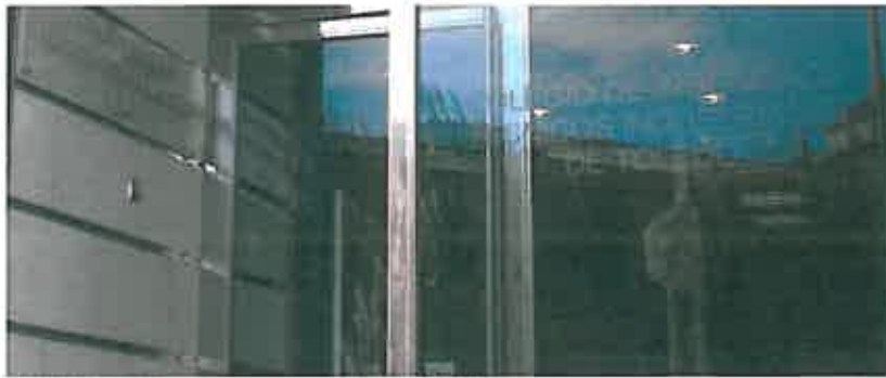
El Colegio de Ingenieros pide a que se le otorguen más plazas de grado.

El Colegio Oficial de Ingenieros Técnicos Industriales de Toledo solicita a las Administraciones Públicas que éstas unan esfuerzos para que sea posible acceder a las nuevas titulaciones de Graduado en Ingeniería, ya que sólo un 5% de las personas que quieren optar al grado pueden hacerlo.