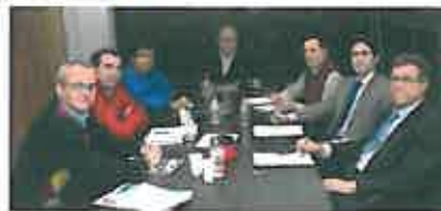
Reunión de los representantes de los colegios profesionales de Ingenierías técnicas de la Región de Murcia. L. O.

A. G. Los colegios profesionales de ingenierías técnicas de la Región de Murcia, que representan a 9.000 profesionales, han solicitado al Gobierno de España que redacte una real decreto en el que se establezca la homologación justa del Ingeniero Técnico actual al grado de Ingeniería, con el único requisito de demostrar una experiencia profesional de 3 años en el ejercicio de la correspondiente profesión.