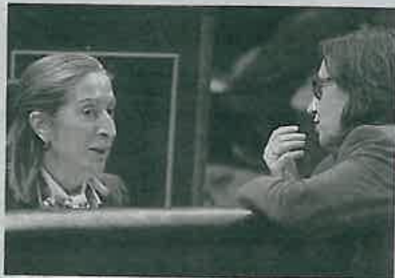
Ana Pastor, el miércoles en el Congreso.

Para el gobierno catalán, esta obra «irracional» tiene un coste imposible de asumir tanto para el Ejecutivo español como para la propia Unión Europea (UE) que, ha recordado, ya «descartó» la construcción de esta infraestructura.