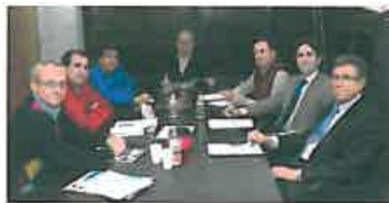
Representantes de los distintos colegios de ingenieros

Los colegios profesionales de ingenierías técnicas de la Región, que representan a 9 000 profesionales, han solicitado al Gobierno nacional la redacción de un real decreto que establezca la homologación justa del ingeniero técnico actual al grado de ingeniería, con el único requisito de demostrar una experiencia profesional de tres años en el ejercicio como ingeniero técnico