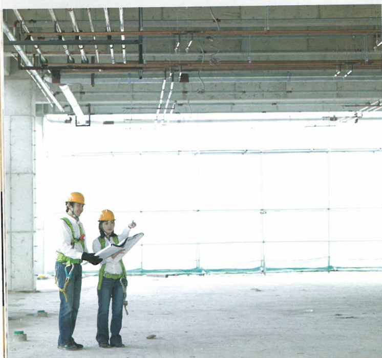
El nuevo Proyecto de Ley no defiende la competitividad de nuestros profesionales

200.000 m 2 o más, la vivienda del guarda de esa nave, y la residencia donde residen los trabajadores de la misma, y sin embargo tenga problemas para firmar una nave agrícola de 50 m 2 , no pueda proyectar la vivienda de ese mismo guarda cuando está en suelo residencial, y por supuesto tampoco pueda firmar esa misma residencia cuando está fuera de suelo industrial. A esto es a lo que nos referimos con la falta de competitividad de nuestros profesionales, que ven limitadas sus posibilidades de actuación en base al uso y no a