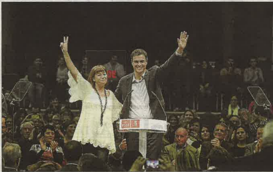
Francina Armengol y Pedro Sánchez, el pasado diciembre, en Palma.

Desde la dirección socialista se ha señalado a este diario que el PSIB siempre ha defendido la «cultura del pacto» y que eso no ha cambiado. Los socialistas siempre han gobernando con otros partidos cuando han ocupado la presidencia del Govern.