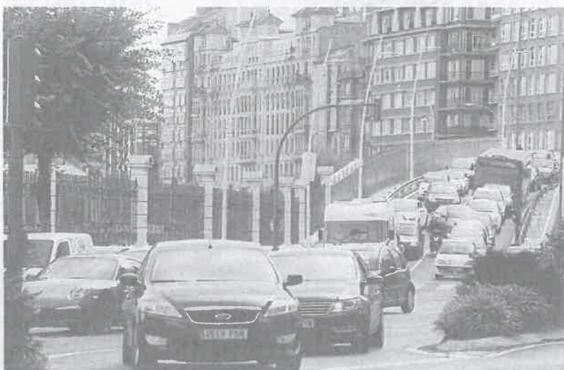
Muchos empleados llegaron tarde a sus puestos de trabajo por la falta de previsión de las obras

Cientos de conductores se quedaron parados con sus vehículos particulares en la principal arteria de entrada a la ciudad así como en Linares Rivas a primera hora de la mañana por la confluencia del caos circulatorio habitual con la restricción de circular por el carril más próximo al puerto en sentido entrada a la ciudad.